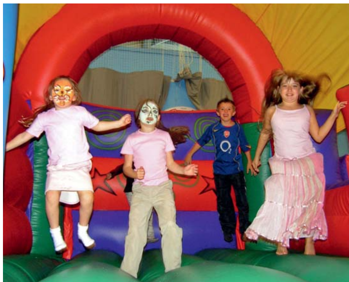
De kinderkermis is er weer van 7 april tot 31 augustus 2012.

Voor scholen is er een arrangement waarbij entree, limonade, een ijsje, frites, een frikadel of kroket zijn inbegrepen. Wilt u een schoolreisje buiten de periode van de kermis, dan kunnen de kinderen hier bowlen en midgetgolven. Ook kermisonderdelen als springkussens en Pannabowl kunnen dan voor u opgezet worden.